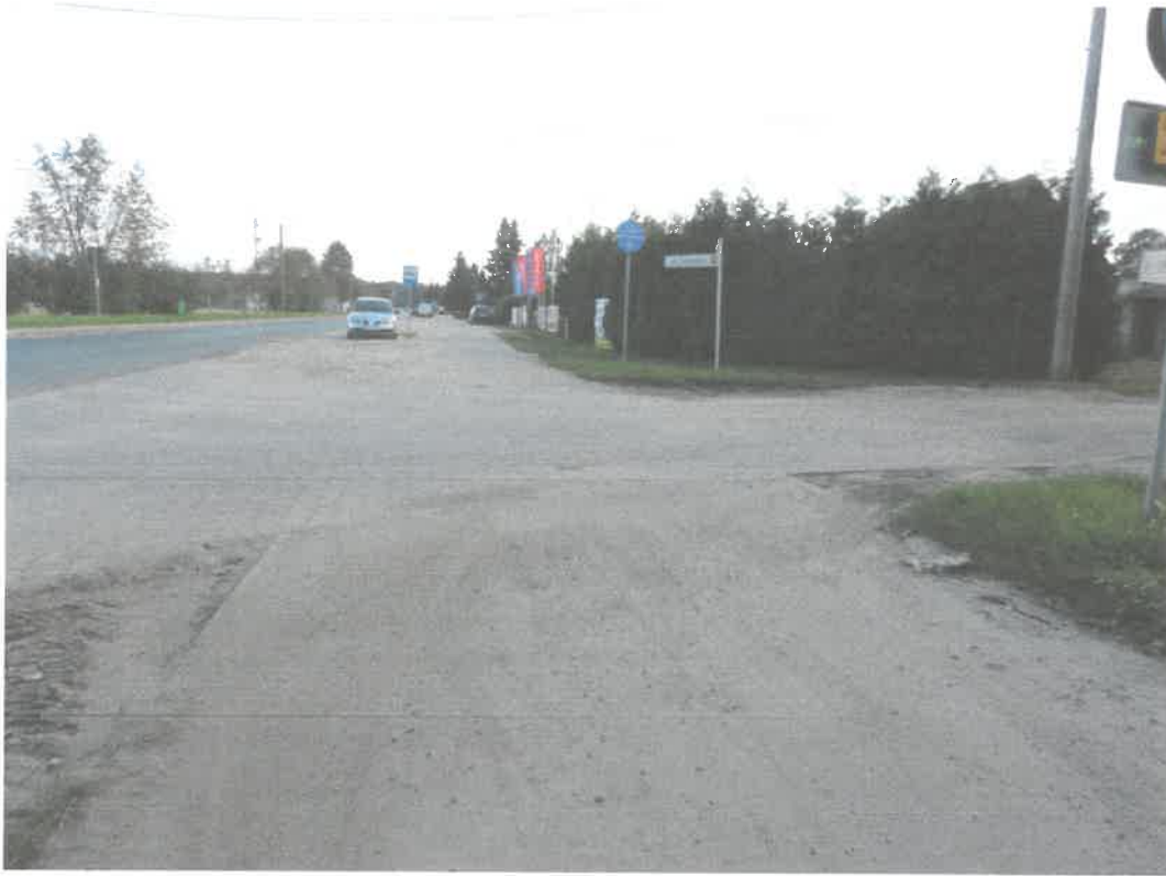
Obniżony wyjazd w stosunku do poziomu drogi