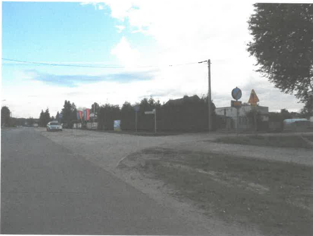
Inne ujęcie wyjazdu