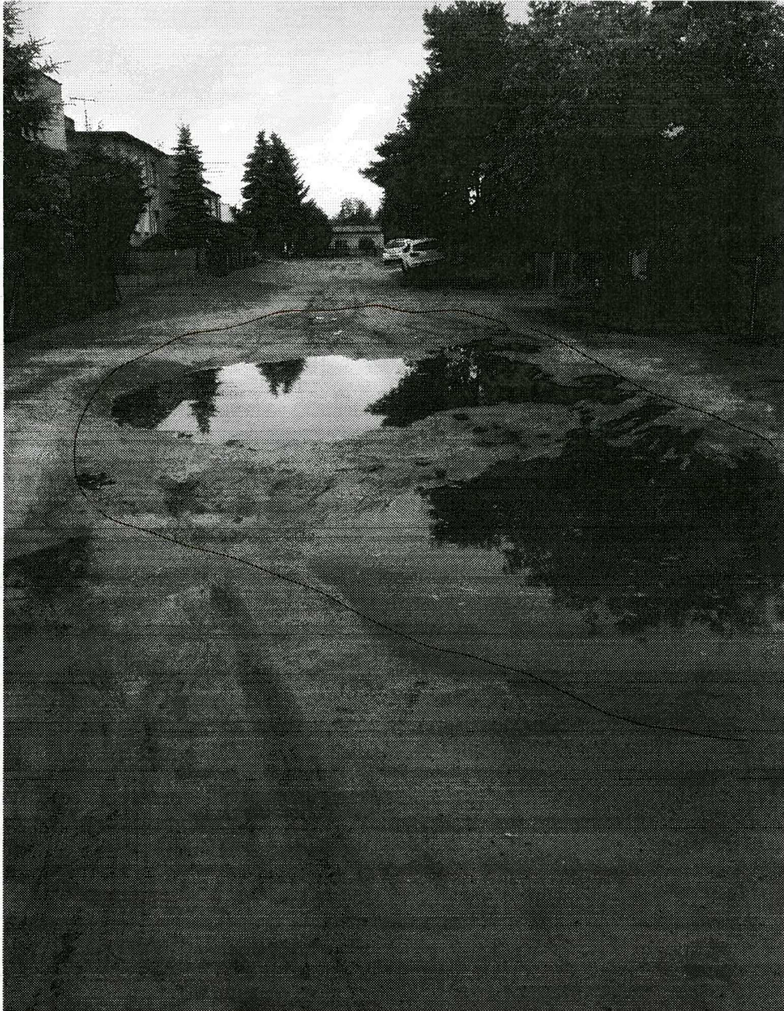
ul. BRZOSKWIŃSKA OD STRONY UL. GRUSZKOWEJ