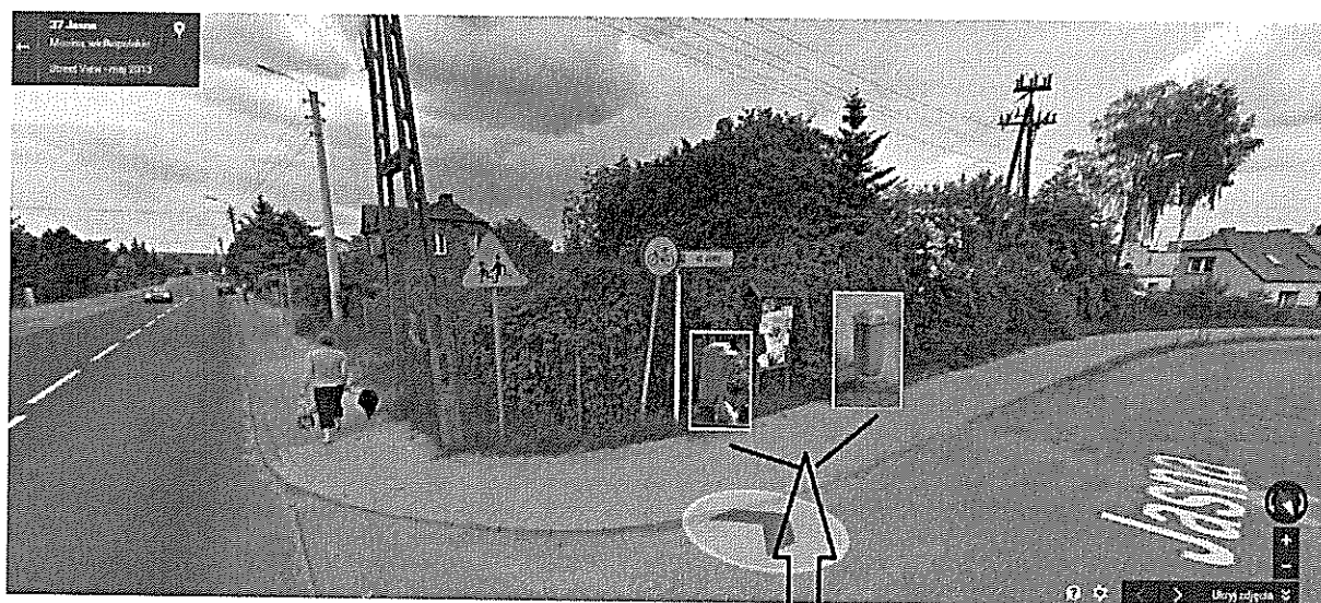
Umieszczenie proponowanych koszy na śmieci