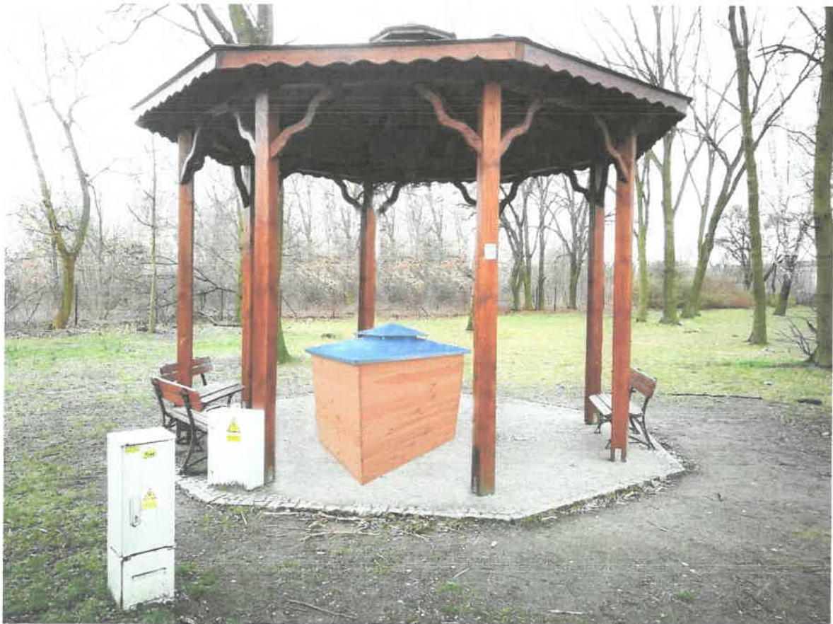
Przykład modernizacji Tężni w Ptasim Parku