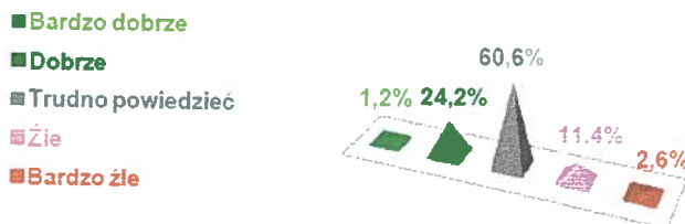
Wykres nr 7. Ocena działalności Rady Miejskiej.